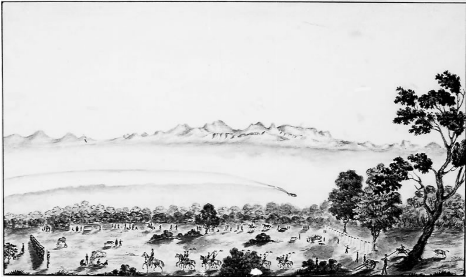
VISTA DE LA LAGUNA DE JACO.