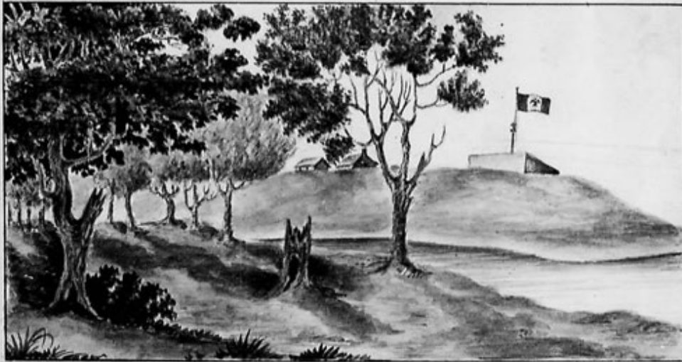
VISTA DEL FORTIN EN LA COLONIA DE MONCLOVA EL VIEJO.